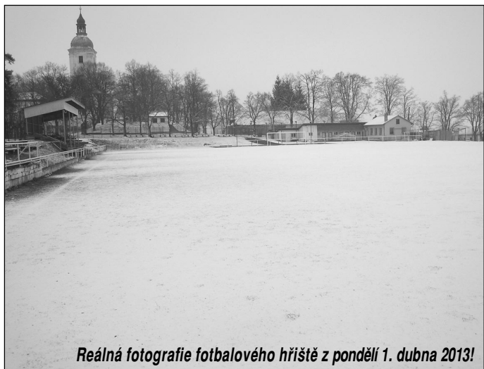
Reálná fotografie fotbalového hřiště z pondělí 1. dubna 2013!

Do druhého poločasu lépe vstoupil tým Chotovin. Hned na začátku si vypracoval šanci, kdy mohl po velmi chytrém pasu od Tomáše Vrhela jít sám na gólmana Zeman, ale nezpracoval dobře balon na hranici vápna. Domácí pak dost přitlačili, prostřídali a dost zkvalitnili svojí hru. Odměnou jim byla branka na 2:1 po chybě v rozehrávce. Náš tým si pořád věřil alespoň na bod. Ale sil hrozně rychle ubývalo, jelikož zdravotní a fyzický stav některých hráčů není ideální. Posledních dvacet minut zápasu se už Chotoviny trápily. Hra se totálně sesypala po 3. inkasovaném gólu. V podstatě už hrál jen tým Malšic. Chotovinám úplně odešel střed zálohy, kudy chodili domácí bez jakéhokoli odporu. V nastavení se podařilo Malšicím dát ještě dvě branky.