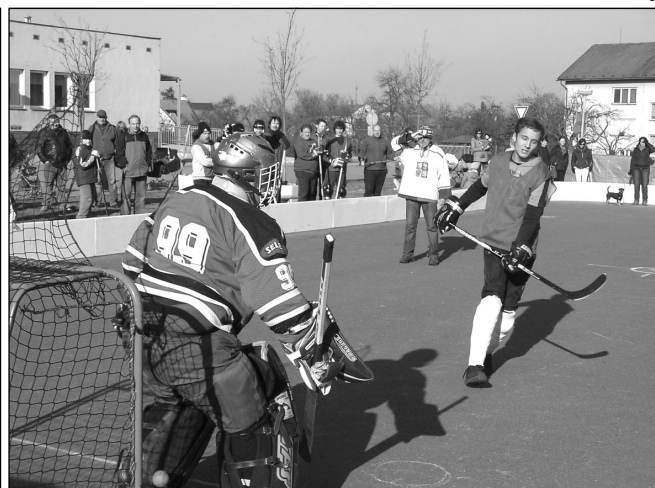
Jeden z proměněných nájezdů chotovinského mužstva